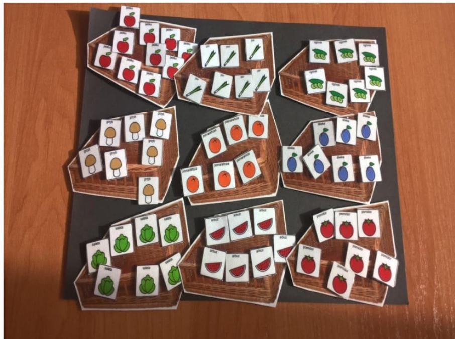
Zdj.3 Wybór produktów