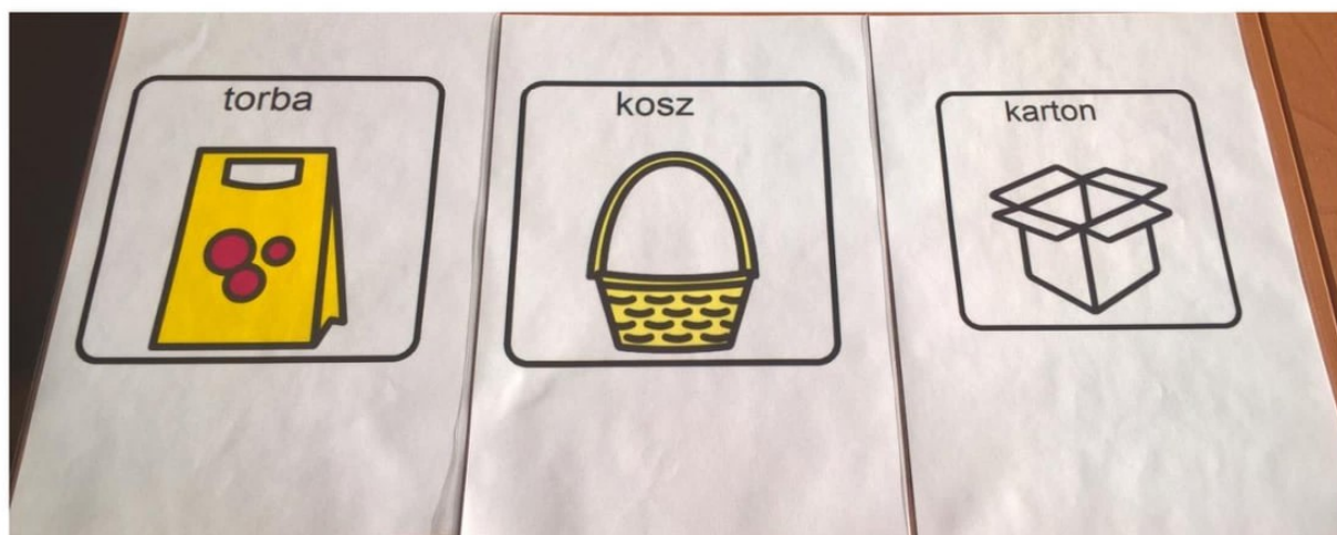
Zdj.5 Wybór spakowania towaru