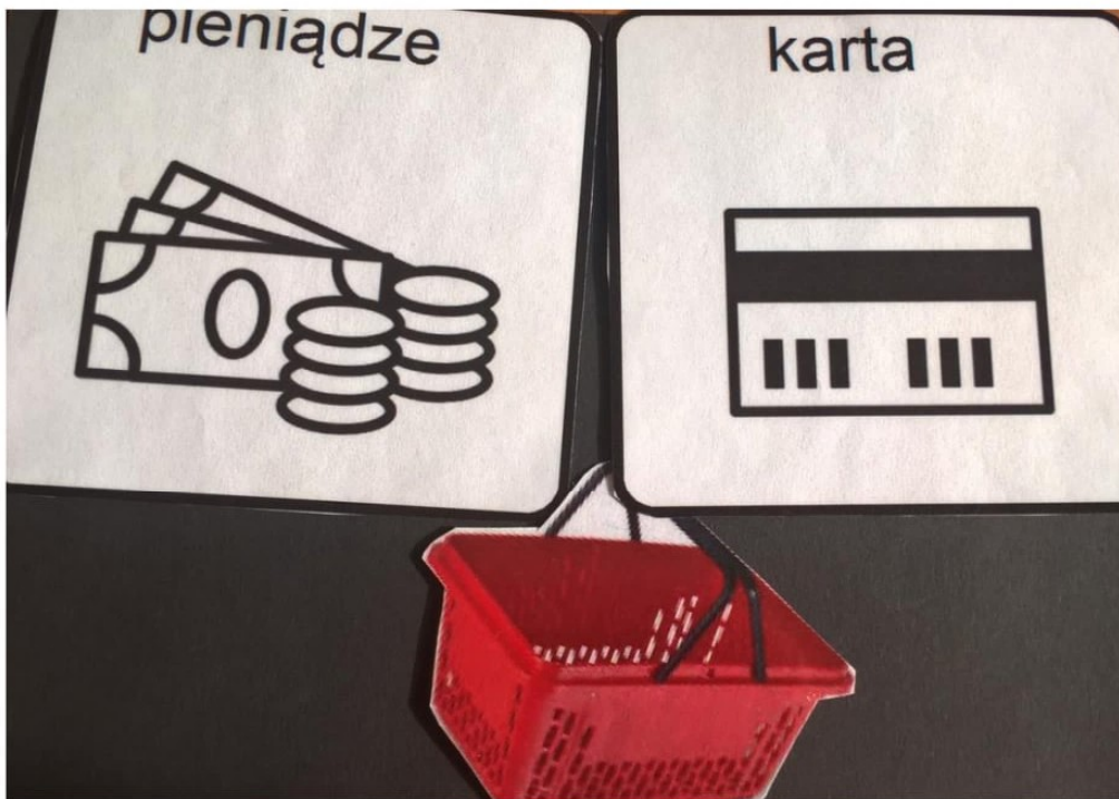
Zdj. 4 Wybór płatności